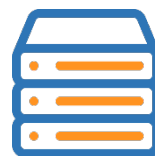
Сжатие и кэширование трафика