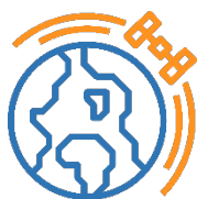
Трафик из интернета

Контроль и управление различными каналами связи , объемом и лимитами передаваемых данных через них, настройка правил резервирования и приоритетов между множеством каналов передачи данных (например, между VSAT, Inmarsat и Iridium).